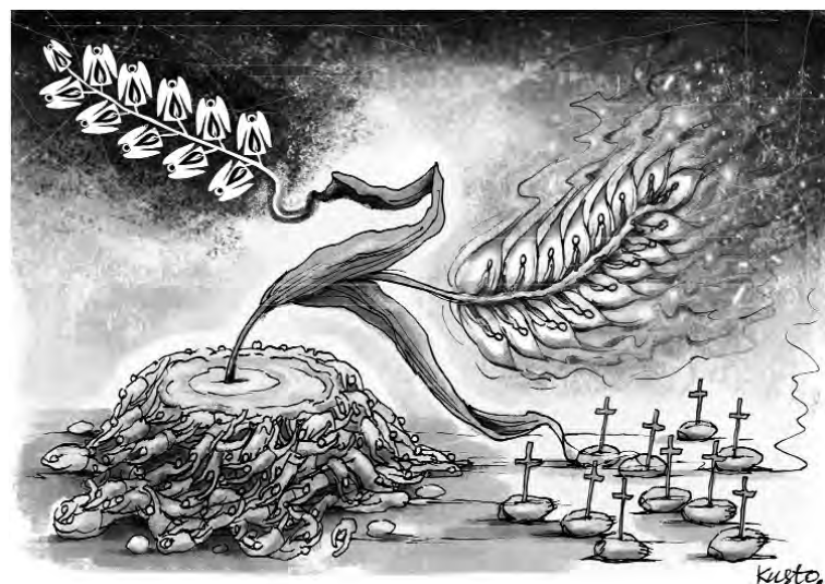
Голодомор: свіча пам'яті.