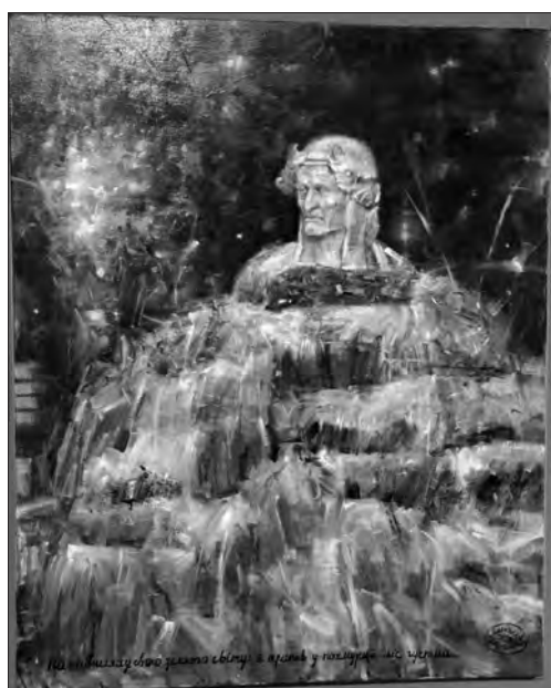
«На півшляху свого земного світу я трапив у похмурий ліс густий...»

Одразу біля входу нас зустрічає сер Вінстон Черчилль, точніше, його портрет, натякаючи на прихильність автора до історичних паралелей. «Never give up!» («Ніколи не здавайтесь!») — попереджає поглядом британський політик, який привів країну до перемоги над Гітлером.