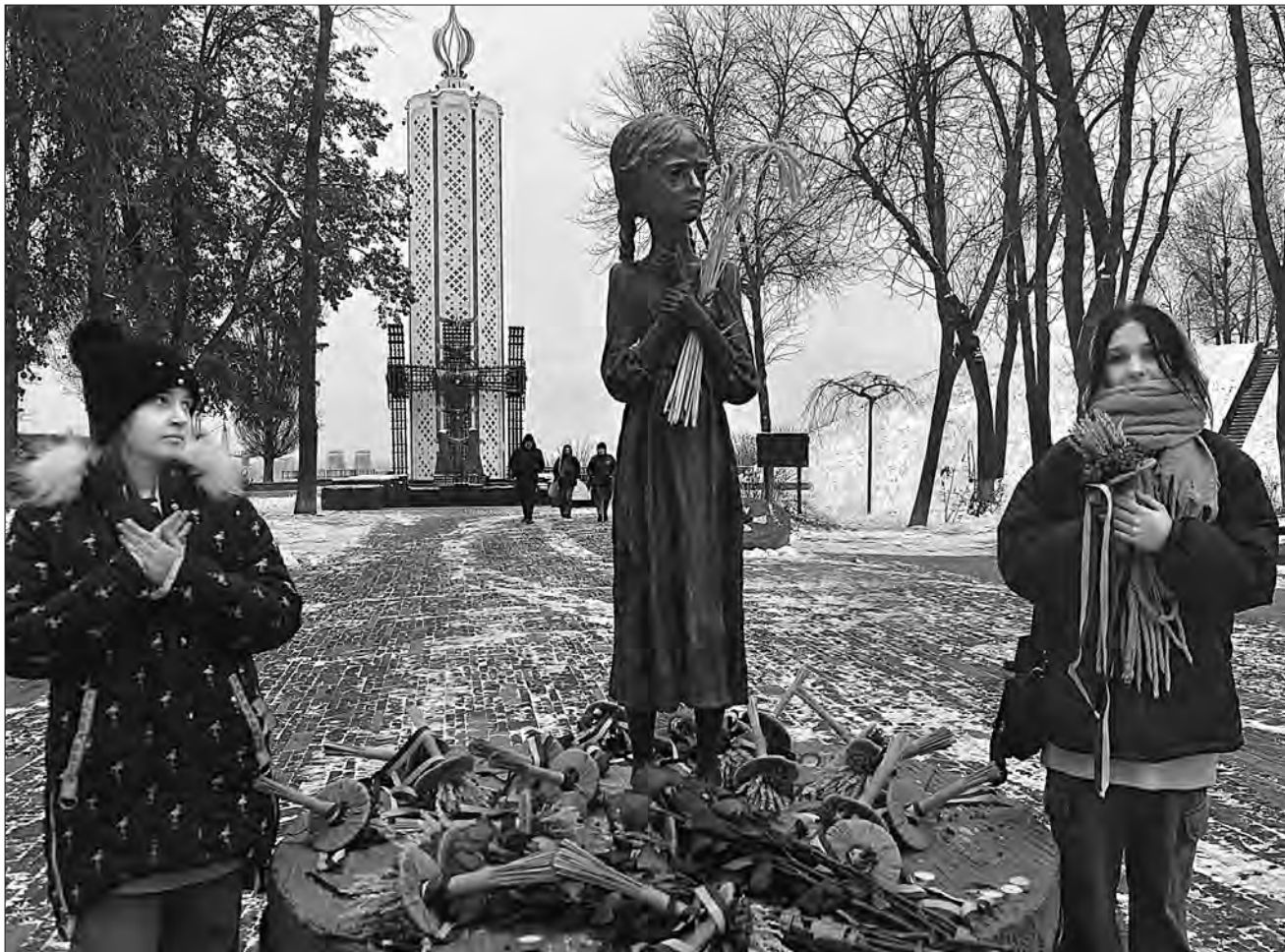
Більше фото тут — www.golos.com.ua